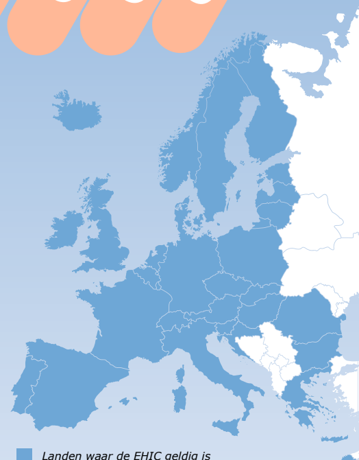
Landen waar de EHIC geldig is